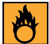
O - Comburant