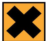
Xi - Irritant