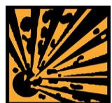
E - Explosif