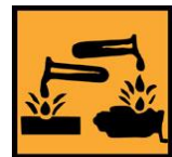
C - Corrosif