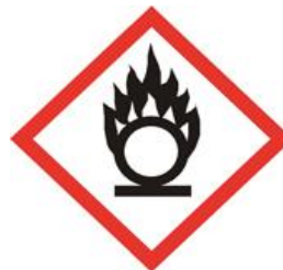
Provoque une incendie ou une explosion en présence de produits inflammables