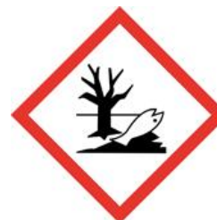
Effets néfastes sur les organismes du milieu aquatique