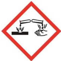
• Corrosif pour les métaux • Corrosif et irritant (peau, yeux)