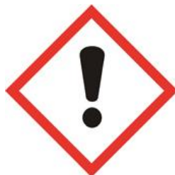
• Nocif par voie orale, cutanée ou inhalation, ou • Est irritant (peau, yeux, voies respiratoire), ou • Provoque des allergies cutanées, ou • Provoque somnolence ou vertiges.