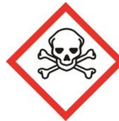
Empoisonne rapidement, même à faible dose. Par voie orale, cutanée ou inhalation.