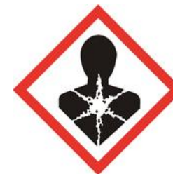
• Est cancérigène, mutagène ou toxique pour la reproduction, ou • Toxicité spécifique pour certains organes cibles après une exposition répétée, ou • Mortel en cas d'ingestion et de pénétration dans les voies respiratoires, ou • Provoque des allergies respiratoires.