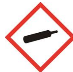
Gaz sous pression dans un récipient